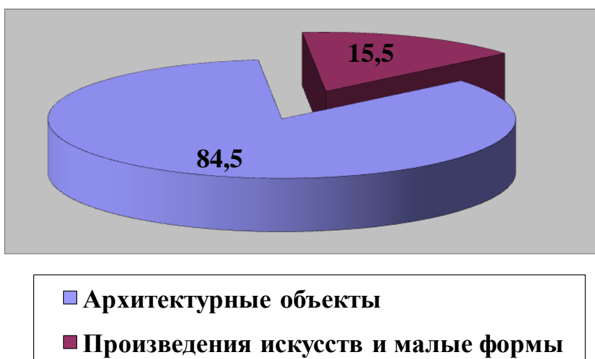
Рисунок 4. Схема реализации жизненных интересов человека

Объем городских площадей и примерное количество художественных форм в г. Алматы