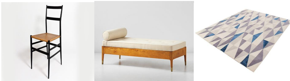
Стул Superleggera, модель 699, Cassina. 1957. Кушетка. Орех, латунь, текстиль. 1959. Ковер Diamantina

5 мая 2019 года в парижском Музее декоративно-прикладного искусства проходила выставка, посвященная одному из самых влиятельных архитекторов и дизайнеров XX века: Джо Понти (1891-1979). Ретроспектива «Tutto Ponti: Gio Ponti, archi-designer» («Весь Понти: Джо Понти, архи-дизайнер») охватывает всю карьеру Понти, который вошел в историю как отец-основатель послевоенных архитектуры и дизайна Италии и мог, как говорил его друг Эрнесто Натан Роджерс, спроектировать всё что угодно – «от ложки до города».