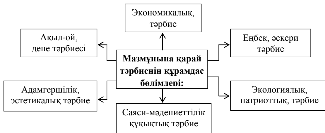
Сурет 1 - Тәрбиенің құрамдас бөлімдері.

Тәрбие мақсаты – ұжым мен жеке тұлға арасындағы тәрбиелік қатынастар жүйесін жүзеге асыру барысында күтілетін нәтиже. Тәрбиенің мазмұнына, атқаратын қызметіне сәйкес оның негізгі құрамдас бөлімдерін ажыратамыз. Оларды төмендегі суреттен көре аламыз (Сурет №1) .