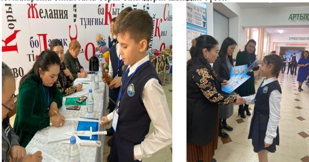
Сурет 2. «Жарқын болашаққа бастау» атты Дарынды мен талантты оқушылардың XVI слеті

шоғырланған сексен Дарынды мен талантты оқушылардың шығармашылық жұмыстары көрмеге қойылып, «Көркем еңбек» номинациялары бойынша жүлделі орындармен марапатталды. Көрмеге оқушылар ұлттық қолөнеріміздің түрлі бағыттары бойынша шығармашылық жұмыстарынан бөлек қорғауда қысқаша баяндама мен жасалу техникасы мен технологияларына сипаттама беріп білімдерін шындай түсті.