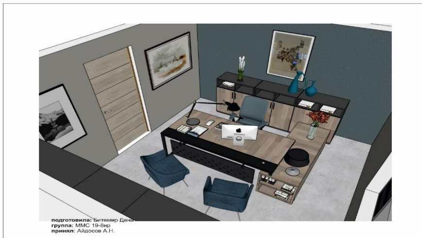
Рисунок 1. Интерьер кабинета заведующего кафедрой в современном дизайне, графическая программа для 3D-моделирования SketchUp