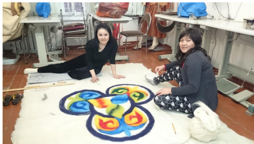
Сурет 4. Заманауи үлгідегі Текеметті басу барысы.

Сонымен халқымыздың ежелден келе жатқан қолөнерінің кейбір түрлері ескіріп, өткен күннің еншісінде қалып, заманның талабына сай өзгеріске ұшырап, түрлі ерекшеліктерге ие болғанымен бүгінге дейін жалғасын тауып келе жатыр. Қазіргі заман сұранысына ие болып жатқан жайы барына, ұлтымыздың өлмес мұрасы ретінде жалғасын тауып, әрі қарай өз елімізде ғана емес, бүкіл әлемге танылады деген үмітпен Қазақ елін паш еткіздіретін өнерімізді дамытып, оны келешек ұрпаққа оқытудың қолжетімді материалдарын шығармашылық іс-шаралар арқылы да жеткізілу түрлері алдағы уақыттарда қарастырылуы талаптары артуда.