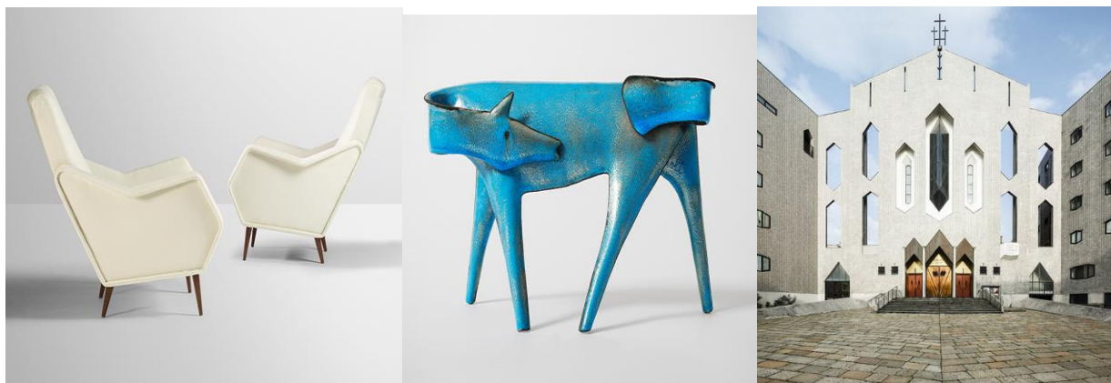
Джо Понти. Церковь Св. Франциска Ассисского в Милане. 1958-1964. Статуэтка «Лошадь», Paolo de Poli. Серебро, медь, эмаль. Парные кресла, Cassina. 1948