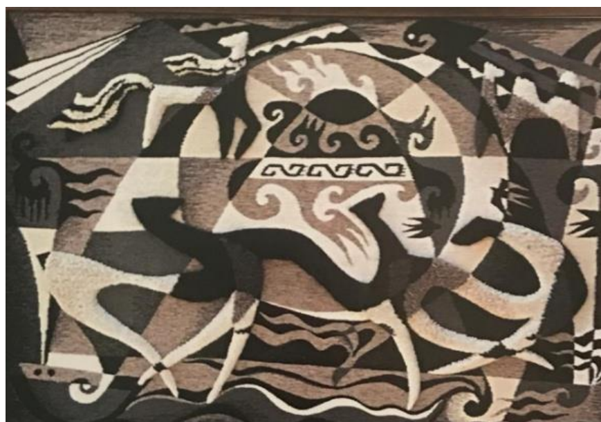
Сурет 5. Жақыпов Құттыбек Атамекен. Гобилен, түкті тоқыма