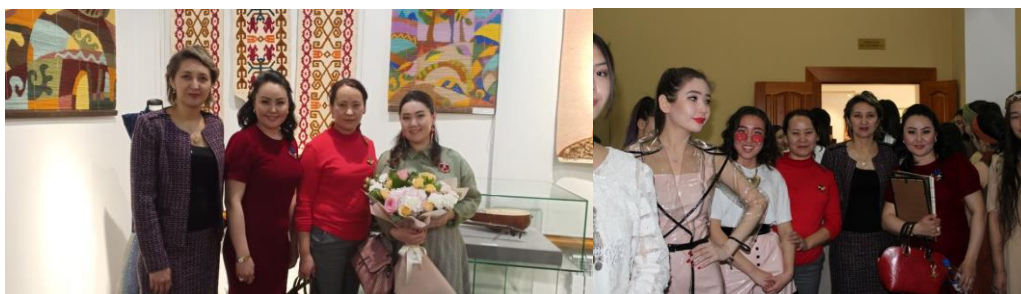
Сурет 1. «Гүлденген көктем» атты шығармашылық көрме.

Еліміз тәуелсіздік алғалы бері дәстүрлі ұлттық өнерімізге назар аударылып, осы іспен айналысып жүрген тұлғалар туралы деректер жарыққа шығып, болашақ ұрпаққа насихаттау мен кеңінен тарату жолында біршама істер атқарылуда. Осы мақсатта жүзеге асып келе жатқан дәстүрлі түрде өтіп тұратын жоғары деңгейлі конкурстар мен фестивальдер және т.б., іс-шараларда өздерін паш етіп елдің назарына есімдерін танытып жүргендердің қатары көбеюде. Оның дәлелі ретінде бүгінде ұлттық өнерімізді паш етуші Алматы аймақтық Degree & Profession (ҚазБСҚА), Республикалық «Шебер», Халықаралық «Шабыт және «Aspara fashion week» конкурстарымызды айтуға болады. Сонымен қатар, ұйымдастырылып жатқан халықаралық, қалалық көрмелерімізде артта қалып жатқан жоқ. Олардың бірі ретінде, Абай атындағы ҚазҰПУ, Өнер, мәдениет және спорт институтының Сән дизайны және сән өнері мамандықтарының профессор-оқытушы құрамы мен студенттерінің Заманауи дизайндағы – ұлттық өнер «Гүлденген көктем» атты шығармашылық көрмесі «Алматы» мұражайында 2020 жылдың 3-12 наурыз аралығында өткен болатын.