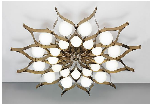
Керамическая чаша Il pellegrino di Montesanto, 1955. Люстра для отеля Parco dei Principi в Риме, 1964

Понти умер в 1979 году в возрасте 87 лет, один из самых влиятельных итальянских архитекторов и дизайнеров 20 века. Его небоскреб - Pirelli Tower - возвышается в его родном Милане. Считается, что Понти всегда был удачливым и хитрым. Мало того, что он сам был плодотворным, но и его проекты были эклектичными, в них сочетались разные стили и идеологии, иногда противоречащие друг другу. Понти изобрел стилистические игры, в которые сам любил играть годами.