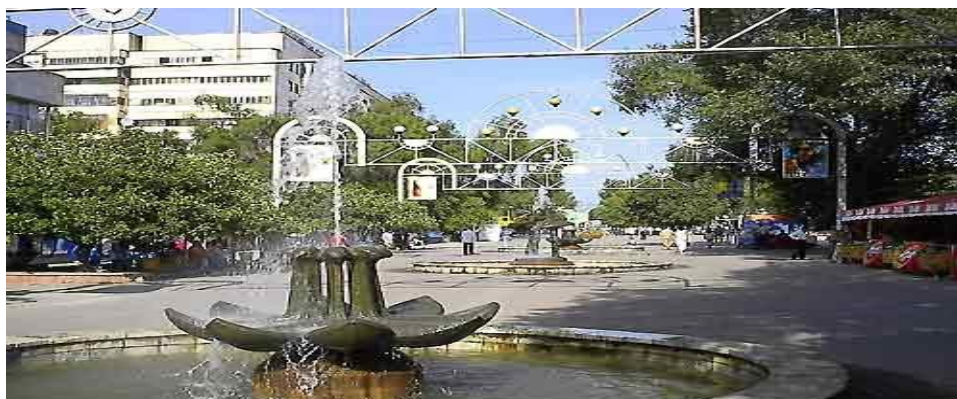
Фото -2, масштаб, размеры, динамичность

Многие исследования в этой области показывают, что архитектурная среда воздействует на человека с трех позиций: 1- с позиций физической формы в пространстве (объемы, линии, пятно, пространство и т.д.); 2- с художественной позиций и динамики (масштаб, размеры, динамичность, организация пространства, ритм, пропорций); и 3- с позиций художественного образа и эмоционального воздействия (выражение композиций, чувства или идеи) Фото -1,2,3.