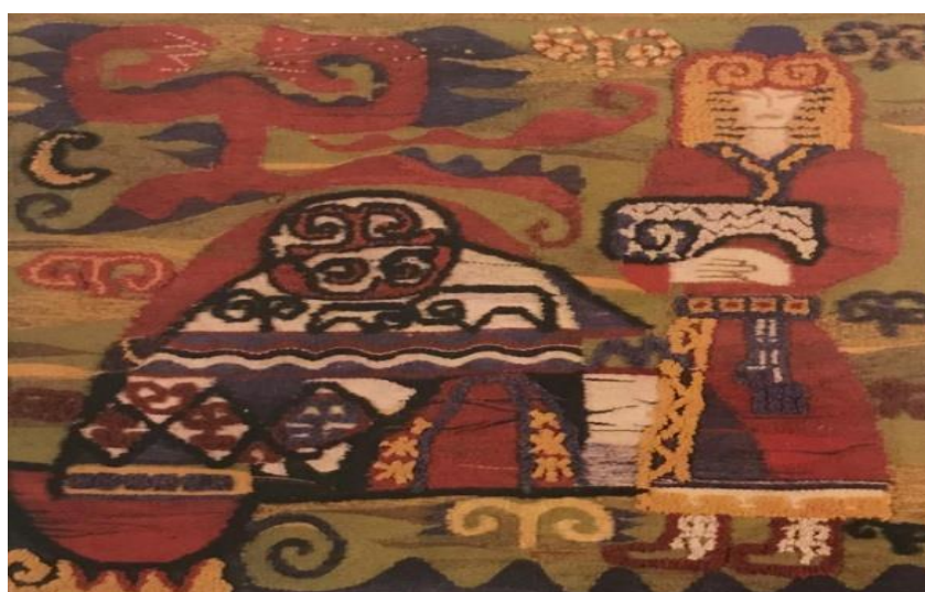
Сурет 4. Құрасбек Тыныбеков Шопан 1970. Гобилен, тоқыма