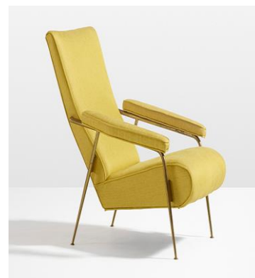
«Вилла-бабочка». Вилла семьи Планиар Джо Понти построил в 1957 году, в Каракасе. Кресло Distex, Cassina. 1954. Переиздание кресла Letizia 1956 г., Molteni & C.

Репертуар Понти-архитектора чрезвычайно широк. У него есть ранние, полностью неоклассические проекты (на архитектора сильно повлияли традиции Андреа Палладио). Это трехэтажный дом на Виа Рандаччо в Милане, проект 1925 года, или частный загородный дом Тони Булье во французском Гарше, проект 1925-1926 годов.