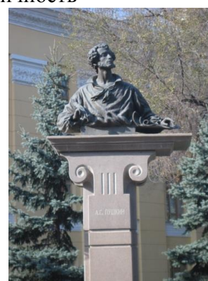
Фото-3, организация пространства, ритм, пропорций Фото -3, выражение композиций, чувства или идеи

Целесообразно выделить различные формы реализации творческого замысла внутри интеграционной концепции.