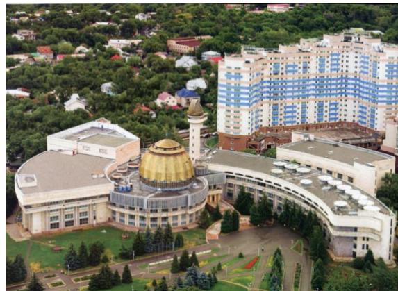
Рисунок 5. пространства для свободного общения. Фото 6. Эмоционально ориентированная городская среда

Таким образом, актуальная концепция социальной адаптации интегрирует теоретические начала, диалогические и игровые подходы, яркие образные решения, направленные на создание эмоционально ориентированной городской среды – пространства для свободного общения, развлечения, хорошего настроения и досуга (Фото - 5,6).