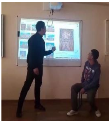
Сурет 1. Шығармашылық талқылау

Осылайша, әр түрлі педагогикалық интерактивті стратегиялардың әзірленген жүйесін пайдалана отырып, эксперименттік оқытуды дамыту методикасын қолдану. Жалпы, студенттерге көркем педагогика саласында интерактивті компьютерлік технологияларды белсенді үйретіп сан қилы жобалармен ғана шектеліп қоймай, оларды жан - жақты пәнаралық жобалармен де таныс ете білу. Демек, адамзаттық құндылықтардың басымдылығын негізге ала отырып, бүгінгі бейнелеу өнері пәндерінің бағдарламаларын білімгерлер үшін әсіресе көркемдік білім берудің міндетті мазмұнын осылайша анықтауға болады. Мысалы: кез келген кезеңдердің сипаттамасына келсек; ол оқушылармен бірлесіп өнер туындыларын талқылауға, олардың шығармашылық қабілетін және коммуникативті дағдыларын дамытуға сол сияқты оқылатын материалды терең түсінуге талпындыру. Мұнда студенттерді еркіндікке және өз ойларын жеткізе білуге үйрету. Студент еркіндікке талпынған сайын, жеке тұлға болып машықтануға тырысады. Шығармашылық ой деңгейлері нығаяды. Осы арқылы 1.2.суретте қамтылған көрініс бойынша студенттердің өзара әрекеттесуімен білімгерлердің оқу мақсаттарына сәйкес іс әрекеті де қалыптасады.