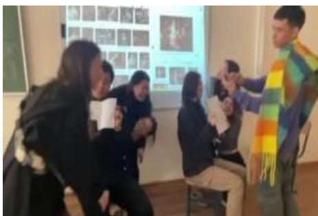
Сурет 2. Шығармашылық талқылау

Негізінен, студенттермен шығармашылық талқылау жүргізу арқылы бірнеше нәтижелерге жетуге болады. Мұнда, білімгерлердің рухани және мәдени деңгейлерінің жаңашылдық көзқарастарының түпті негізі өнерге деген қызығушылықтарының қалыптасуы мен дамуы арқылы көрініс табады.