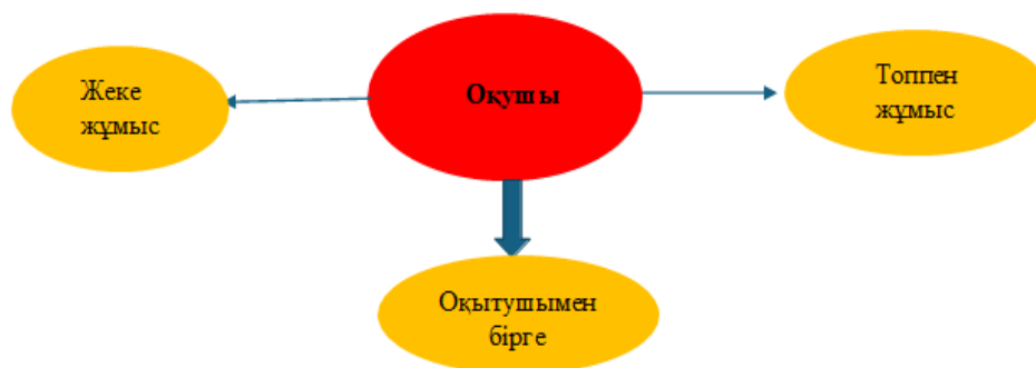
Сурет 3. Оқушының шығармашылық бағыты

Осылайша, жоғарыда көрсетілген сурет негізінде берілген мәліметтер арқылы білім алушылардың ойлау қабілетінің тереңдеу деңгейін салыстыруға мүмкіндігі туады. Жеке және топтық тапсырмалардың нәтижелерін талдау арқылы балалардың шығармашылық ойлау қабілетінің даму ерекшеліктерін анықтай аламыз. Демек, мұндағы жұмыстарды салыстыру арқылы олардағы терең ойлар мен тұжырымдарды анықтау үшін зерттеу жүргізуге болады. Әрине, әрбір пән мұғалімі өз сабақтарында түрлі методикаларды қолдана отырып, оқушылардың белсенділігін бірнеше әдістермен пәнаралық байланыс жасай отырып бағалауға болады. Жалпы, көркем педагогиканың дамуы және нақты әдістері мен коррекциялық жұмыстарының түрлері арасындағы органикалық байланыс оқыту процесін тиімді етуге мүмкіндік береді. Сонымен қатар, ондағы негізгі жағдайды ескере отырып, олардың оңтайлы комбинациясындағы бірнеше әдістерін де өте мұқият таңдауды талап етеді. Оқытушы өз шеберлігін пән аралық стратегиялар жүйесі арқылы ұтымды қолданған жөн. Мысалы; тарихи көріністі еске түсіретін болсақ;