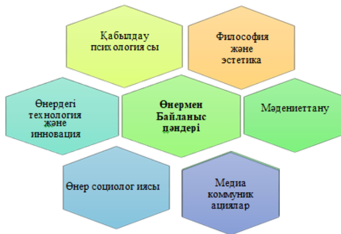
Сурет 4. Пәнаралық байланыс

Пәнаралық байланыс студенттерге жүйелі түрде көркемдік және бейнелеу өнері туралы білімдерін нығайтуға, өнер туындыларына шығармашылық құштарлықтарының артуына әр түрлі қызықты формалармен танысуға және басқа да өнер формаларында көркем-бейнелі ойлау және бірлесіп еркін жұмыс жасау арқылы білімгерлер мен оқытушылардың қарым-қатынас қабілеті ұлғая түседі. Демек, қазіргі заманғы оқыту процестері күрделі шешімдерді қажет етеді және оларды бір ғана пән шеңберінде табу мүмкін емес. Сондықтан да пәнаралық байланыстар мен білімдерді интеграциялауға көбірек көңіл бөлінсе нақты нәтижеге жете аламыз. Соған орай, әрбір пәннің сәйкестігіне қарай жіктеп негізгі принциптерін таба білу.