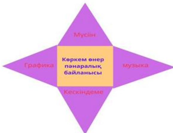
Сурет 5. Пәнаралық байланыс

Сондықтан да жоғары сапалы, заманауи оқытуды жүзеге асыру үшін жаңа әдістемелерді әсіресе, көркем педагогика саласында кәсіби білім беруде көбірек қолдану қажет. Нақты айтатын болсақ, бірнеше пән аралық байланыс арқылы оқытушы түрлі методикалармен байланыс жасай білу керек, ол 5 суретте көріп отырғанымыздай көркем өнер пәндерінің интеграциясы.